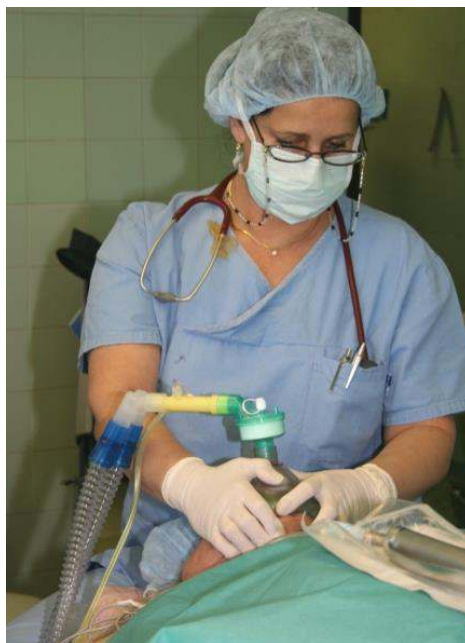
3. kép: Általános érzéstelenítés (narkózis)

Szükség lehet továbbá izomlazító (relaxáns) adására, amely megkönnyíti az intubációt és a lélegeztetést, javítja a műtéti feltárás körülményeit és csökkenti az altatószerigényt.