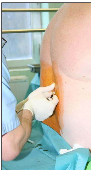
1. kép: Spinális érzéstelenítés

Az érzéstelenítőszer befecskendezzük a gerincvelői folyadékba – ezt nevezzük spinális érzéstelenítésnek (1. kép). Az érzéstelenítés megkezdése előtt fertőtlenítő folyadékkal lemossuk a bőrt a gerinc ágyéki szakaszán, majd a tűszúrás leendő helye körüli bőrfelületet érzéstelenítjük. Ez után kerül sor az injekciós tű gerincvelői folyadékba történő bevezetésére. A gerincoszlop azon részén, ahol gerincvelő már nem található, csak gerincvelői folyadék. Spinális érzéstelenítés esetén a test deréktól lefelé érzéketlenné válik.