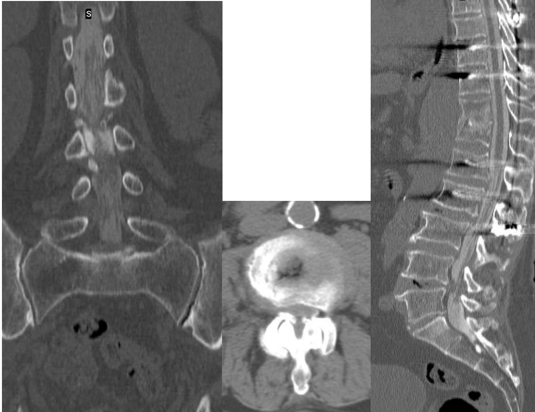
4-6. ábra Mielográfia után készült CT vizsgálat képei: elölről, haránt, oldalról